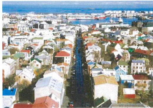
レイキャビク市街