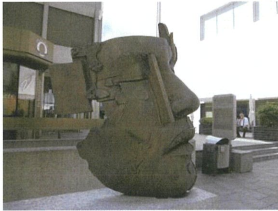
リヒテンシュタインの路上アート