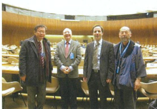
スペイン国際人権法協会メンバー