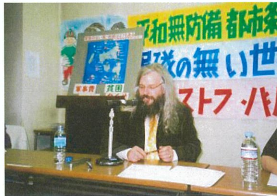
クリストフ・バーベイ