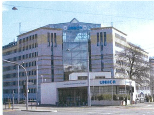
国連難民高等弁務官事務所