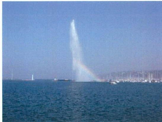
ジュネーヴの大噴水の写真