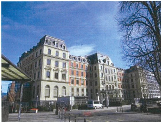
国連人権高等弁務官事務所パレ・ウィルソン