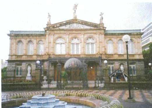
コスタリカの国立劇場