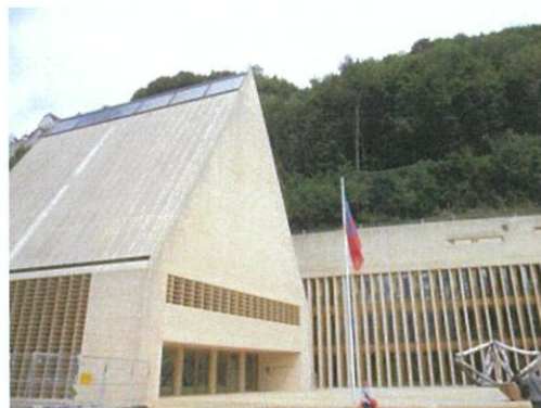
リヒテンシュタイン政府