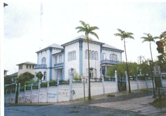
コスタリカの議会