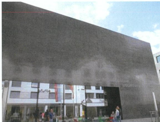
リヒテンシュタイン美術館