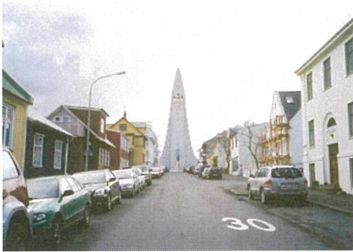
レイキャビクのハトリグリム教会