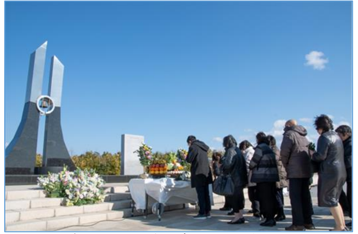
平成 31 年 3 月岩沼市・千年希望の丘