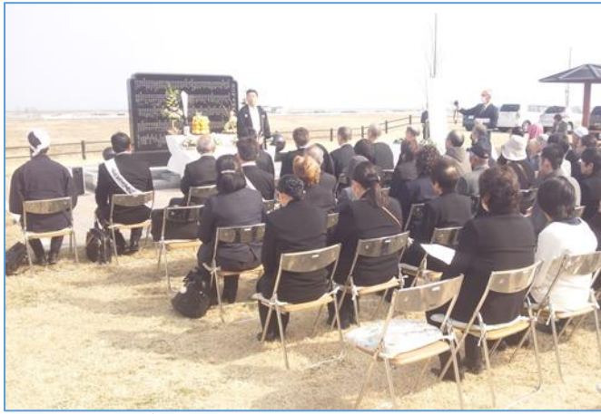
平成 30 年 3 月浪江町・慰霊碑