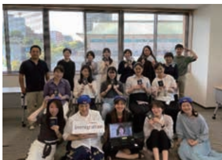
ご搭乗ありがとうございました！

続いて行われた修了式は、客室乗務員に扮したスタッフより、全5回のプログラムを修了する「飛行機の着陸」が告げられた。参加者はイミグレーションにて入国ビザを受け取り、この旅を通して「自分が変わった」「人生の選択肢が広がった」「諸宗教の姉妹ができた」など自分が得たもの、そして新たな旅への抱負を語った。