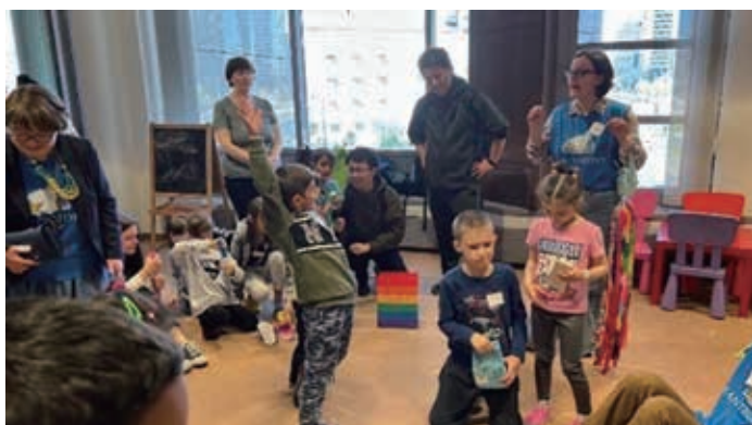
ウクライナ周辺国 現地調査報告から