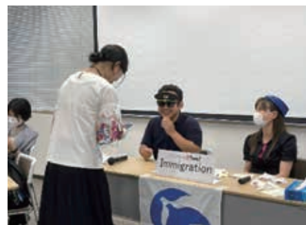
入国手続き。CAからのメッセージが書かれたピザを受け取る